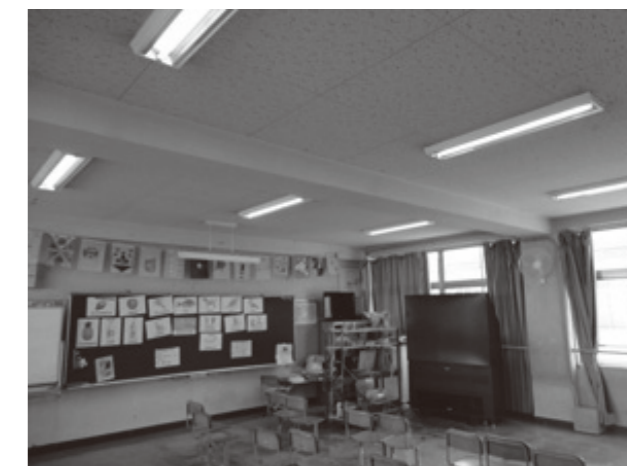
奈良県／立治道小学校 教室にてテスト設置中

アイゼットでは現在無料おためしキャンペーンを実施中です。カタログやデモ器では伝えることができない実際の点灯状況をご確認頂けます。