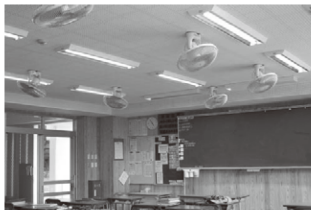
沖縄宮古島／平良中学校 教室