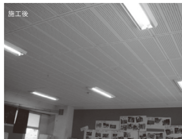
長野県／飯島小学校 教室

※施工前は天井面に光のムラが出来るが、施工後はムラがなくなり空間全体が明るくなる。天井の補修を一切必要としない取替工事は、作業効率・コスト抑制の面でも大きなメリットとなります。